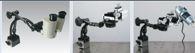
Noga dual arm with Dino Lite (Digital Microscope)