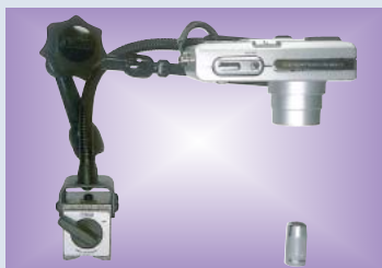
撮影アングルを強力にロックするフレックスアームに落下防止用フレキシブルチューブを添えた安全二重構造の デュアルアームプロ&ミニ