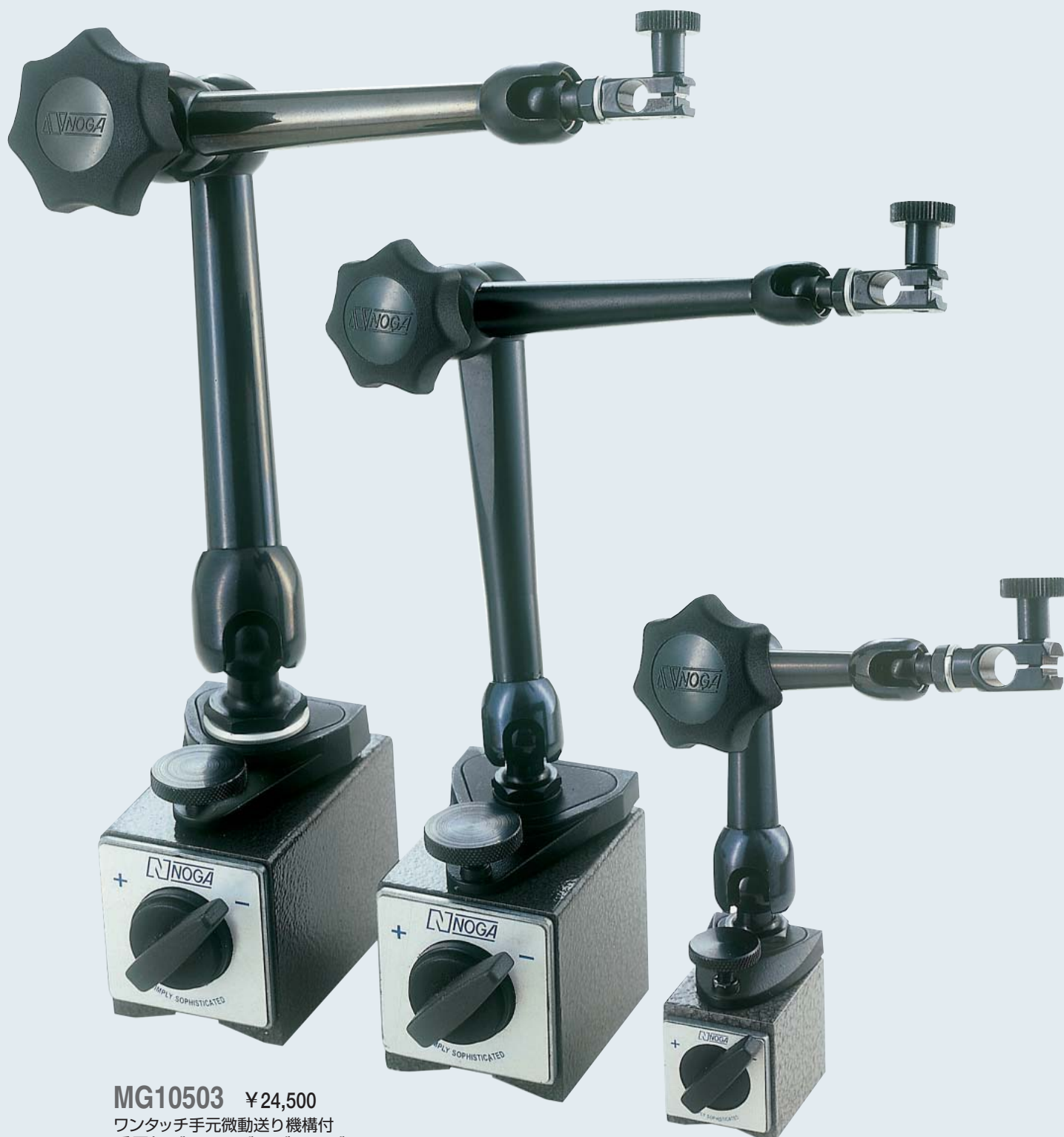
MG10503 ¥24,500 ワンタッチ手元微動送り機構付 重量級ダイヤルゲージホルダー 80kgf.オンオフマグネット付