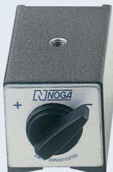
DG0038 ¥3,700 100kgf. オンオフ マグネット