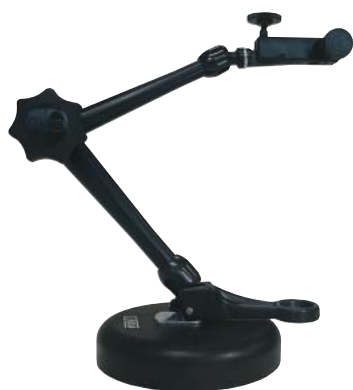
DG1040 ¥22,000 バキュームベースホルダー 微調整機構付