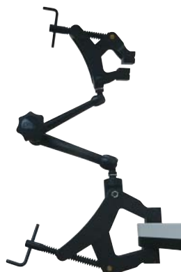
DG1400 ¥25,000 ノガ標準クランプホルダー 2" (50mm)、3" (75mm) クランプ付