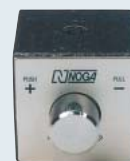
NF0036 ¥2,800 17kgf. オンオフ マグネット