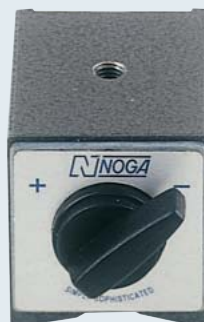
DG0036 ¥2,800 80kgf. オンオフ マグネット