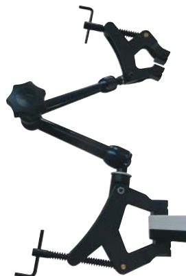
MG1400 ¥31,000 ノガ重量級クランプホルダー 2" (50mm)、3" (75mm) クランプ付