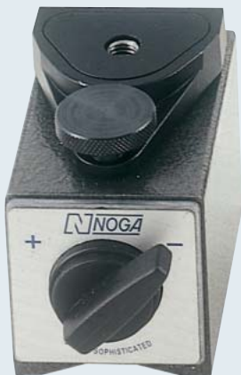
DG0118 ¥9,200 100kgf. 手元微動送り付 オンオフマグネット