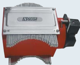
DG0037 ¥16,500 自在形オンオフマグネット サイズ: 52×90×54mm 重量: 0.6kg ねじ寸法: M8×1.25 保持力: 41kgf.