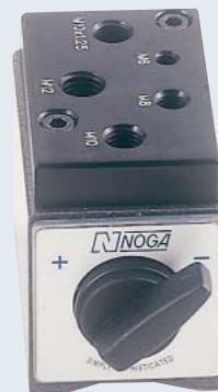
DG1003 ¥9,980 100kgf. ねじ穴5ヶ付 オンオフマグネット