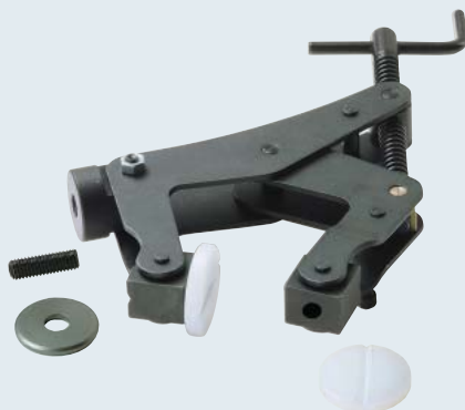
MA0322、MA0320、 MG1006、MG1003、 MG0125 (3" & 4" クランプ) ※右図参照。