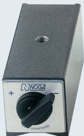
DG0039 ¥5,600 130kgf. オンオフ マグネット