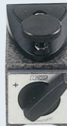
NF3778 ¥6,000 32kgf. 手元微動送り付 オンオフマグネット