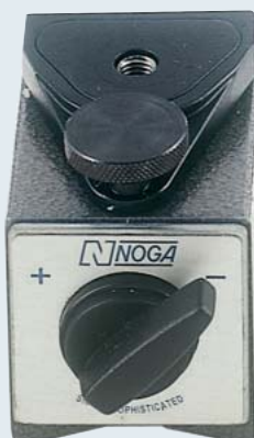
DG3678 ¥6,200 80kgf. 手元微動送り付 オンオフマグネット