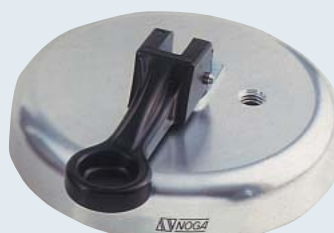
DG0040 ¥9,800 バキュームベース φ92mm 35kgf. (参考値)