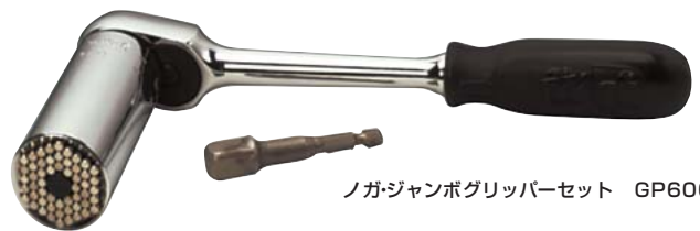
ノガ・ジャンボグリッパーセット GP6000

グリッパーをセットで購入されると専用のラチェットハンドルとコードレスドリル・電動ル用アダプターが付いていますので大変便利です。