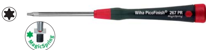
267 PR マジック スプリング付のトルクス®ドライバー

ヘッドに回転カップが付いている上、握り部がゴム仕様であるため、指先で回しやすくなっています。