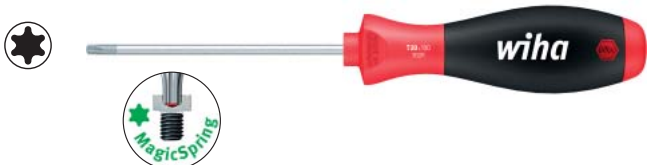
362 R ソフトフィニッシュ®ハンドルのマジック スプリング付トルクス®ドライバー

ブレードはクロームバナジウム鋼製。全身焼入れ、クロームメッキ仕上げ。先端はクロームトップ加工のため、精度が高くトルクス®ねじにピッタリフィットします。人間工学に基づいたマルチコンポーネントハンドル仕様で、ねじを回し易くなっています。