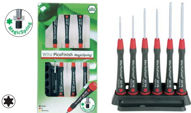
267 PRK 6 マジック スプリング付トルクス®ドライバーの6本組セット

指先で回しやすしいピコフィニッシュハンドル付。吊り下げ用穴付の使い易いプラスチック製ラックが付いています。