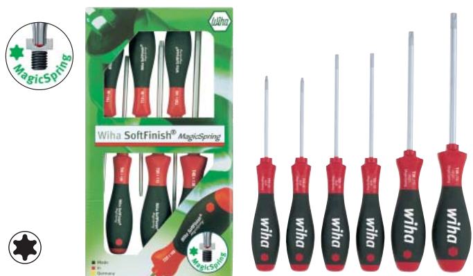
362 RK6 SO マジック スプリング付トルクス®ドライバーの6本組セット