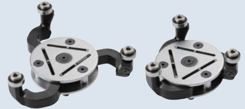
PC2000(装填前の状態) PC2000(収納時) 製造元：ノガ社(イスラエル製)